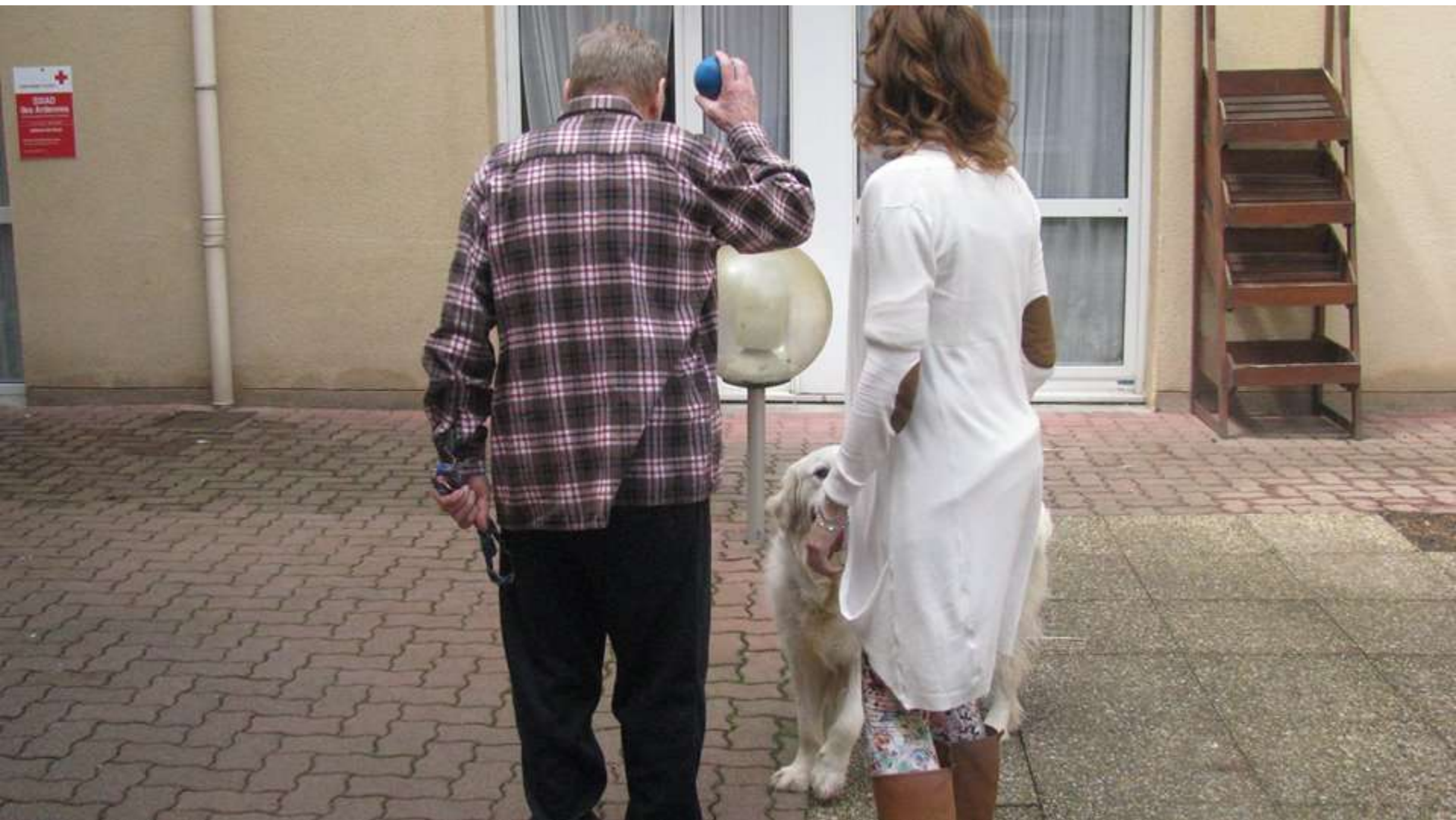
Jeu de balles dans la cour